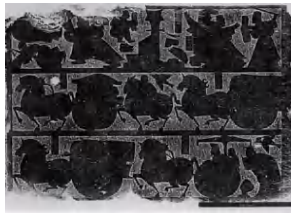
荆轲刺秦王（画像石） 东汉