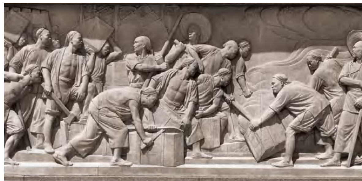
虎门销烟(浮雕·局部) 1958 曾竹韶