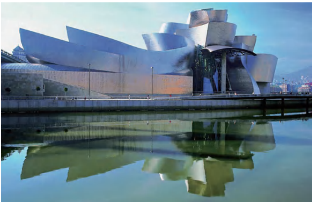
西班牙古根海姆博物馆 1997 弗兰克·盖里（美国）

● 作品背景简介： 古根海姆博物馆位于西班牙巴斯克重镇毕尔巴鄂市内维隆河畔的文化区，1997年正式揭幕，占地2.4万平方米，其中展区1.1万平方米，有19个展厅。整个结构体由美国加州建筑师弗兰克·盖里设计。