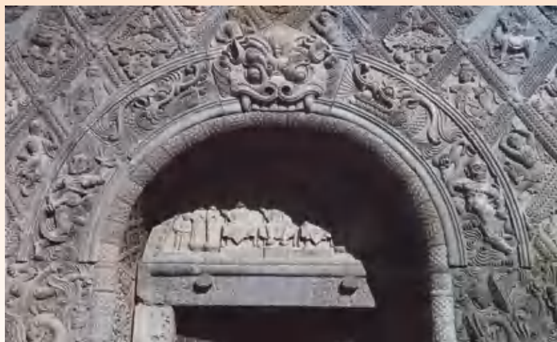
修定寺塔门额(浮雕) 唐代

本图为塔南面拱形券门额部雕饰，券门顶端中央为一大型兽面，依次而下有龙、力士、腾蛟等。门洞内石质半圆形门额上有一铺造像，三佛居中，两旁立弟子、菩萨、天王，共九尊。券门内侧和里门石质门框均有花卉纹饰，浮雕工艺精良，装饰趣味浓厚。