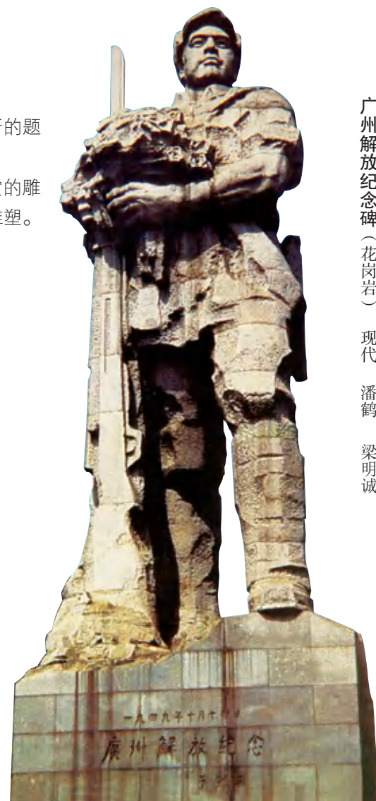
广州解放纪念碑(花岗岩) 现代 潘鹤 梁明诚