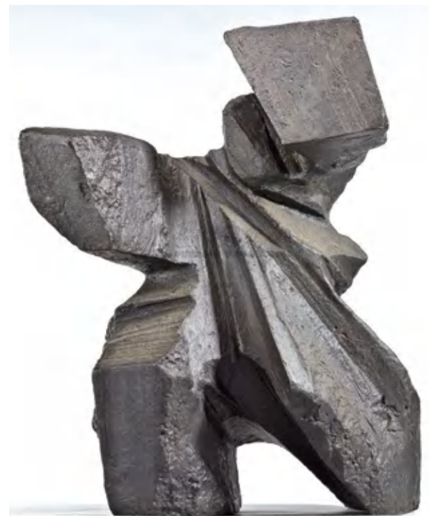
太极系列(雕塑) 1995 朱铭

2. 圆雕是完全立体的，观众可以从不同角度观赏的雕塑。浮雕是在平面底板上塑造或刻制出的一种凸起的雕塑。