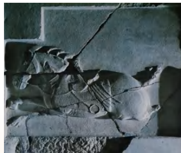
白蹄乌（浮雕·昭陵六骏之一） 唐代

卧牛回首仰望，神情安详宁静，显示出坚韧耐劳、质朴敦厚的性格，圆睁的双目，肥大喘息的鼻和宽厚的嘴，使牛的形象更为真实生动。牛四肢盘曲，蹄质棱角分明，成功地表现了牛的温良驯服、健壮有力的特点，俨然一头关中秦川牛形象。